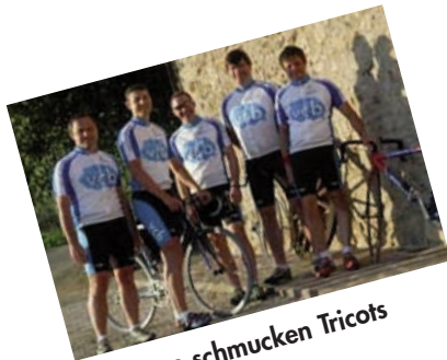
Unsere schmucken Tricots